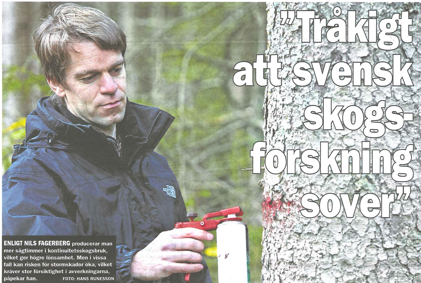
ENLIGT NILS FAGERBERG producerar man mer sågtimmer i kontinuitetsskogsbruk, vilket ger högre lönsamhet. Men i vissa fall kan risken för stormskador öka, vilket kräver stor försiktighet i avverkningarna, påpekar han.